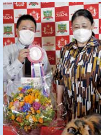
チャンピオンシップ3位