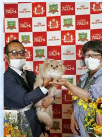
プレミアシップ 3 位