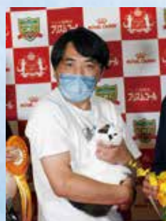
プレミアシップ 3位