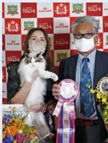
チャンピオンシップ2位