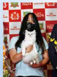
プレミアシップ 4位