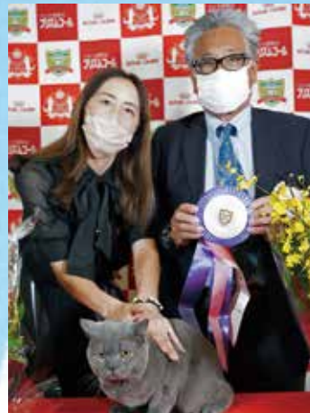
チャンピオンシップ 3 位