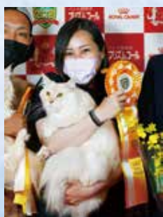
プレミアシップ 2位