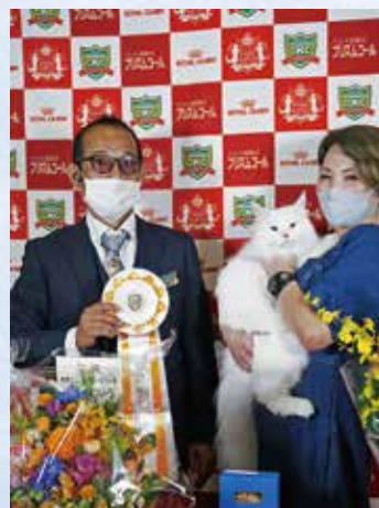
プレミアシップ 2 位