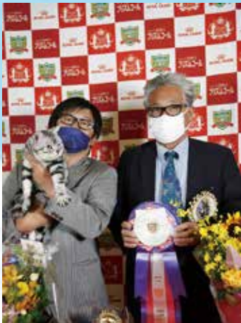
チャンピオンシップ 1 位