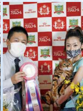
チャンピオンシップ4位