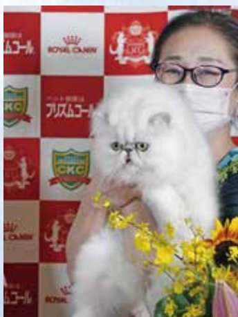
チャンピオンシップ1位