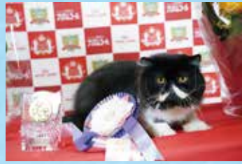
チャンピオンシップ 2 位