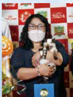
プレミアシップ 1位