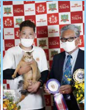
チャンピオンシップ 4 位