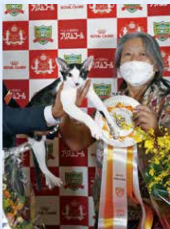
プレミアシップ 1 位